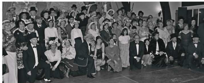
Fotografia de grup de persones vestides d'època

Us esperem el dissabte 20 d'abril, a les 21.45h, a la carpa de la Giralda on tindrà lloc el ball vuitcentista i també es realitzarà la tercera foto de grup de la Fira Modernista del Penedès.