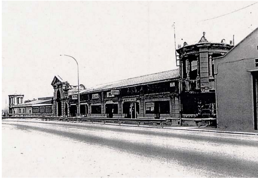
PORTALADA NEOCLÀSSICA (enderrocada) av. dels Herois de 1808, 100-102