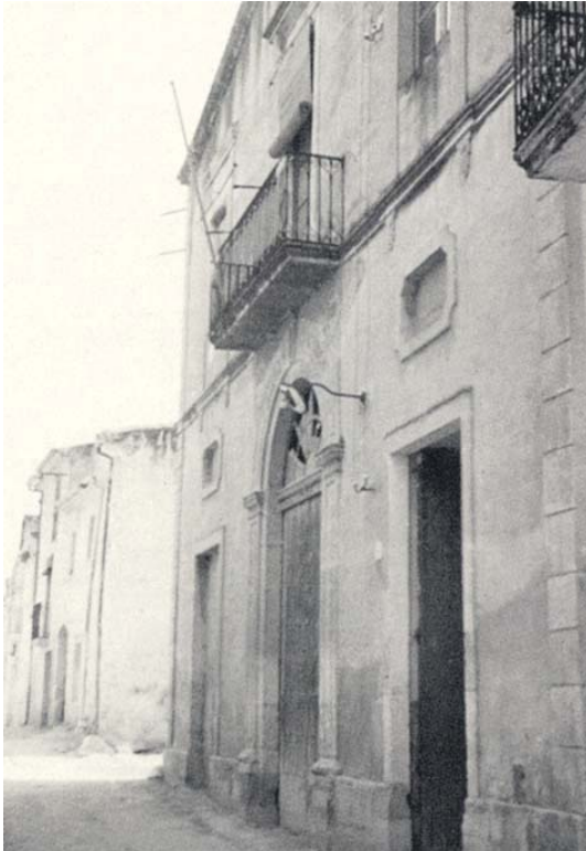
ANTIGA ESCOLA MUNICIPAL (CAL JATET) (enderrocada) Façana carrer Andreu Lleó